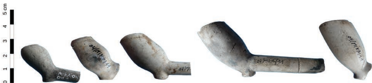
Afb. 4. Typologie van de aangetroffen tabakspijpen (04-MIKA-11). Links het meest vroege exemplaar uit de eerste decennia van de 17de eeuw. Rechts een trechtervormige pijp uit het laatste kwart van de 17de/ begin 18de eeuw.

Interessant bij Vlaamse vondstcomplexen die in de 17de eeuw gedateerd kunnen worden is of er lokaal of regionaal geproduceerde tabakspijpen geïdentificeerd kunnen worden. Om deze vraag te kunnen beantwoorden is gekeken naar zowel de gemerkte als naar de ongemarkeerde exemplaren. Aangezien de kleipijpmodellen in overeenstemming met de gangbare West-Nederlandse modellen zijn, kunnen er geen specifieke lokale of regionale producten herkend worden. De gemerkte producten kunnen allemaal aan het productiecentrum Gouda worden toegeschreven. Vermeldenswaardig hierbij is wel dat er diverse Goudse producten met een zogenaamd 'Zeeuws