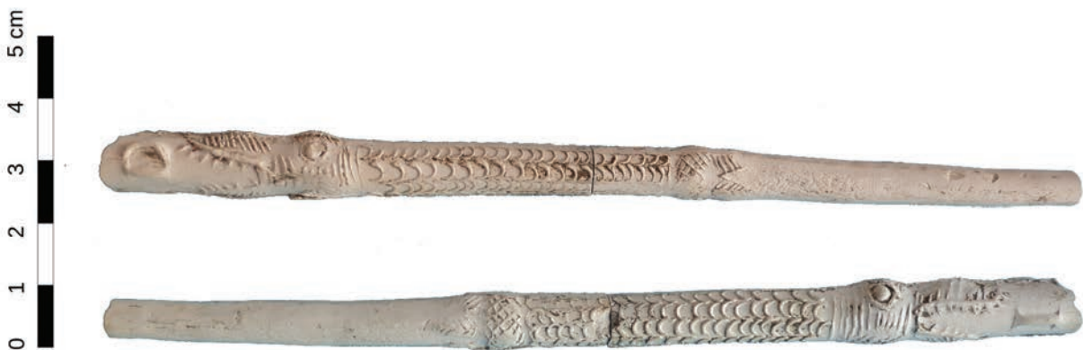
Afb. 8c. Steelfragment van Jonaspijp, gevonden bij de opgraving van het kasteel van Middelburg in Vlaanderen. De steel met de letters D/I is geproduceerd in Gouda.