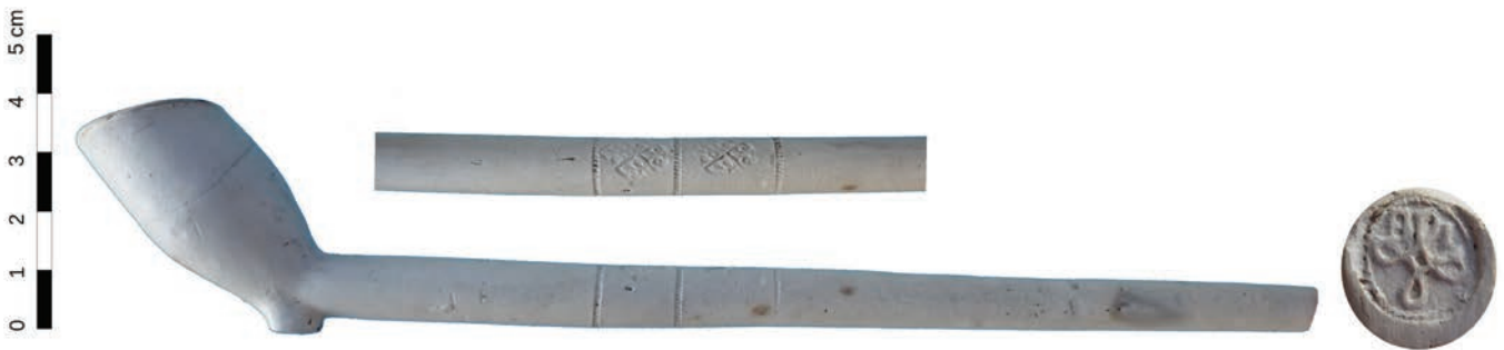
Afb. 6. Trechtersvormige Goudse pijp met een steelversiering in de vorm van een lelie in ruit. Hielmerk is de strik met initialen BI. Een product dat kan worden toegeschreven aan de Goudse pijpenmaker Bastiaan Jansz Overwesel. Merk niet op schaal.

opgraving aangetroffen. Allereerst is dit een zeskantige pijp die helaas geen hielmerk draagt. Deze trechtersvormige tabakspijp kan in het eerste kwart van de 18de eeuw gedateerd worden en aangenomen wordt dat dit product in Gouda is geproduceerd. Daarnaast zijn diverse fragmenten van Jonaspipen aangetroffen. Naast een complete ketel zijn dit ook diverse stelen.