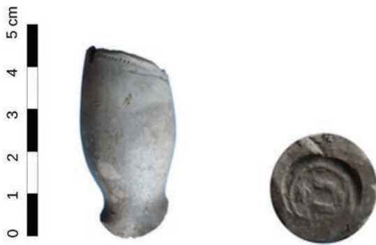
Afb. 5. Goudse kleipijp van het 'Zeeuws model' met het merk II onder een ster, opgegraven in Middelburg in Vlaanderen. Datering tabakspijp: 1650-1675. Merk niet op schaal.

model' zijn aangetroffen. Deze 'Zeeuwse modellen' hebben, net zoals sommige kleipijpen geproduceerd in Gorinchem en Bergen op Zoom, 26 een grotere ketelin-