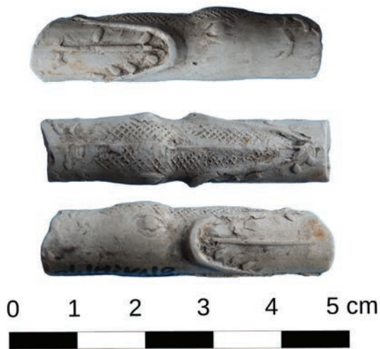
Afb. 8b. Steelfragment van Jonaspijp, gevonden bij de opgraving van het kasteel van Middelburg in Vlaanderen.