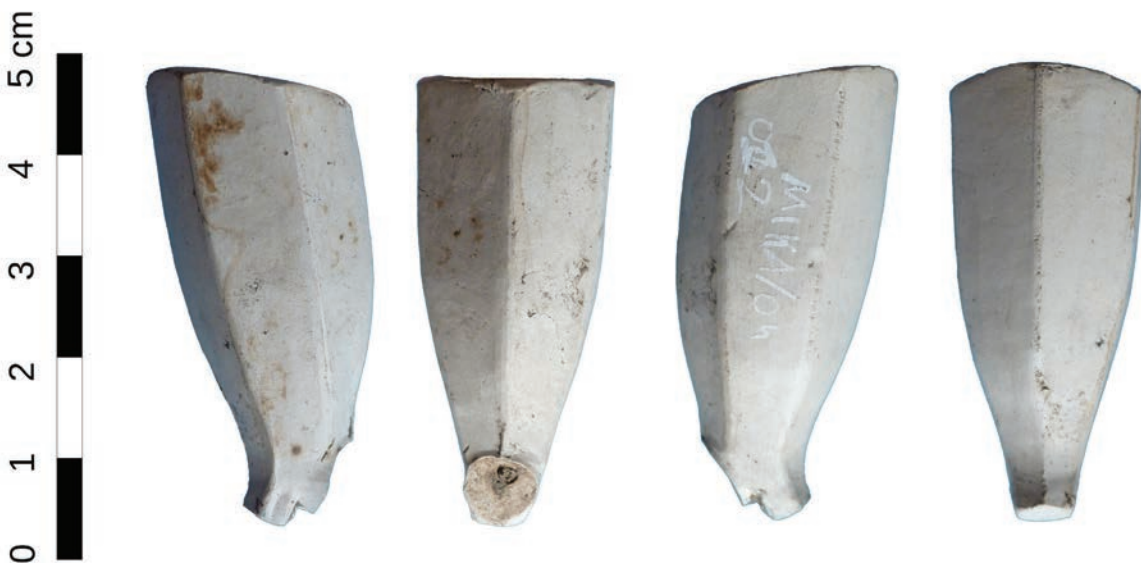
Afb. 7. Trechtersvormige zeskantige (Goudse?) tabakspijp die gedateerd wordt in het eerste kwart van de 18de eeuw.

Het geeft echter wel stof tot nadenken en verbreedt het beeld dat dit type versierde tabakspijpen vooral met zeevaarders en zeevaart gerelateerde wijken/gebieden in verband kunnen worden gebracht.