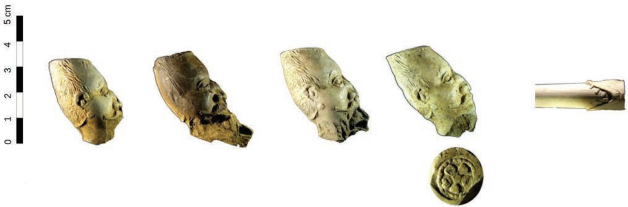
Afb. 9. In Gorinchem geproduceerde Jonaspipen opgegraven in Milsbeek. Deze Jonaspipen zijn in het jaar 1644 weggegooid. Naar Van Oostveen 2015. Merk niet op schaal.