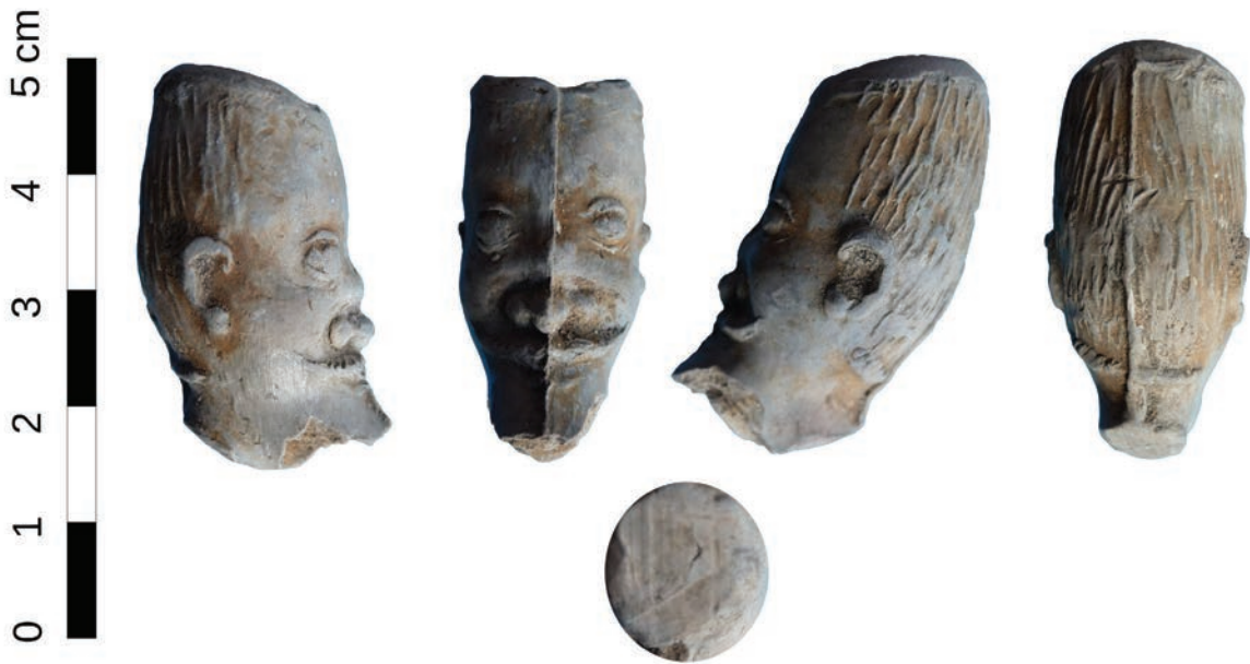
Afb. 8a. Fragment van Jonaspijp, gevonden bij de opgraving van het kasteel van Middelburg in Vlaanderen. Mogelijk is dit een Gorinchems product. Foto Jan van Oostveen ( http://kleipijp.home.xs4all.nl ).